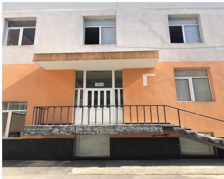
ВХОД Г “СПОРТ”